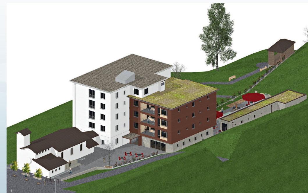
En num dalla cumissiu da beghegiar Il president Lucas Tuor

La fin november 2017 ein ils profils vegni tschentai e la damonda da baghegiar inoltrada. La lubientscha da baghegiar ei avon maun aschia ch'il project sa vegnir realisau. L'idea primara da saver entscheiver a baghegiar gia la primavera 2018 havein denton stuiu midar cun quei ch'in project da tala dimensiun drova buna ponderaziun e planisaziun e surtut era temps per che tut seigi madir. El decuors dalla stad/atun 2018 vegn schau offerir tut las lavurs per aschia dar la badellada l'entschatta 2019.